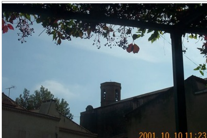
Azimut de la prise de vue : 125 gr